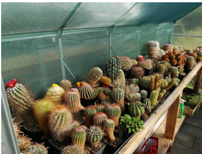
Pohled do sbírky Petra Springla.

Petr Springl má sbírku u svého rodinného domu v obci Chlum svatě Maří. O členství se zajímal již v minulosti. Zaplatil si členský příspěvek, ale pro velké pracovní vytížení záhy skončil. V průběhu roku 2018 se jeho situace změnila a Petr se mezi nás vrátil. A především se plně zapojuje do spolkové činnosti a je velmi aktivní. Sběrka se rozkládá ve dvou menších sklenících na ploše cca. 10 m 2 . Převažují kaktusy. Petr si oblíbil ferokaktusy, mamilárie, astrofity, parodie a v menším množství i jiné druhy kaktusů. Ze sukulentů to jsou euforbie a pachypodia. Na jeho velké zahradě jsou k vidění i jiné zajímavé rostliny.